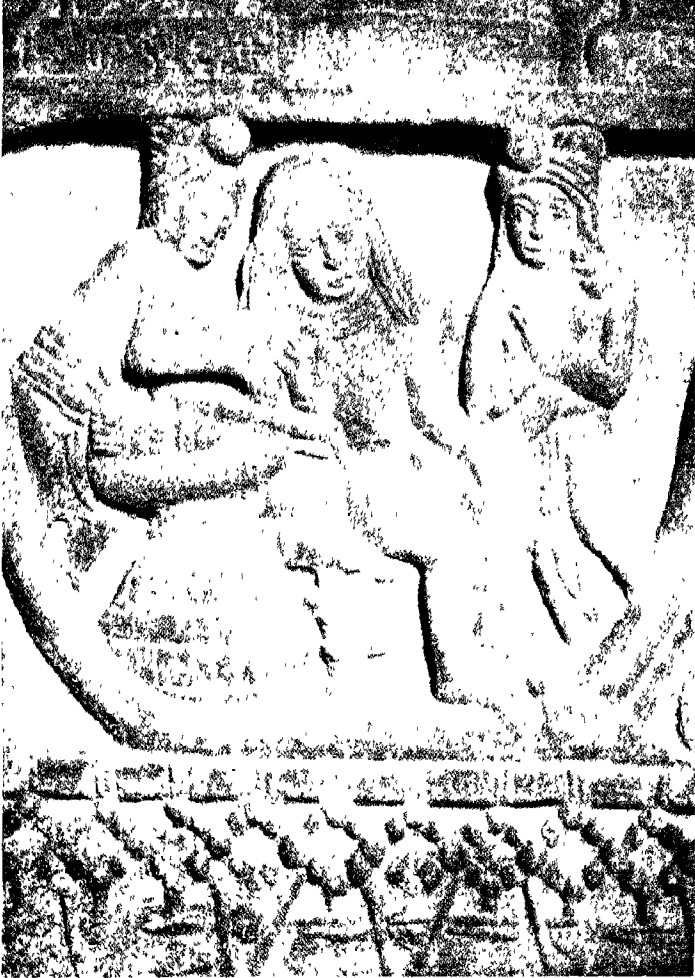
मखादेव जातक (६)